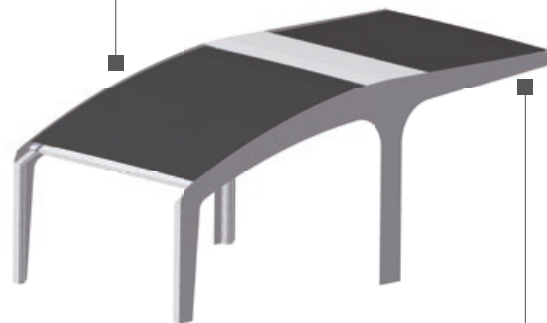
Rolling Shade 2500

Remarque : Disponible à partir du 2 ème trimestre 2018