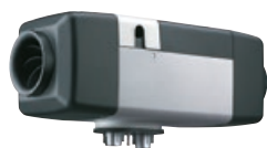
Chauffage à air