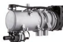
Chauffage à eau