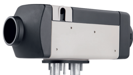
Air Top 2000 STC