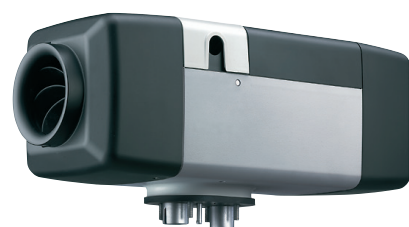
Air Top Evo 40 nebo 55