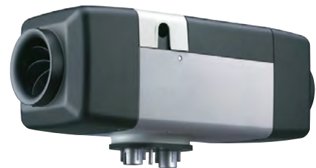
Air Top Evo 40 oder 55