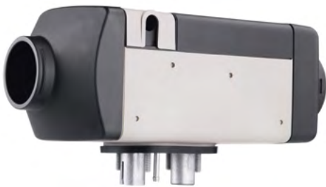
Air Top 2000 STC