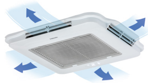
Cool Top Trail 34