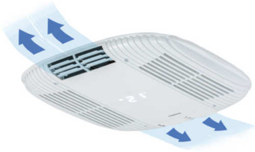
Cool Top Trail 20/24