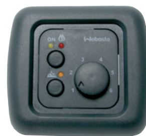
Mando Diesel Cooker X 100