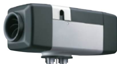
Air Top Evo 40 lub 55