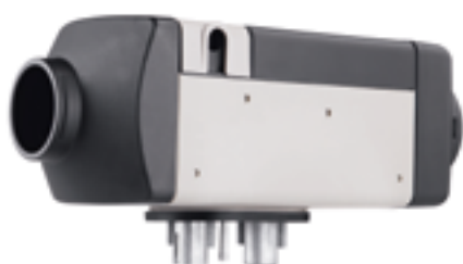
Air Top 2000 STC